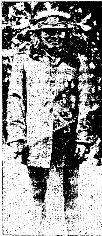
Un Indio de San Blas

5.—La Conferencia debería considerar los medios para habilitar regiones apartadas para la colonización como medio de combatir la desocupación.